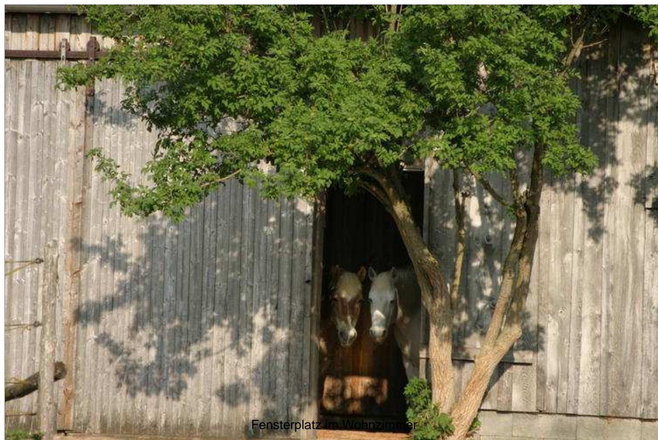
Fensterplatz im Wohnzimmer