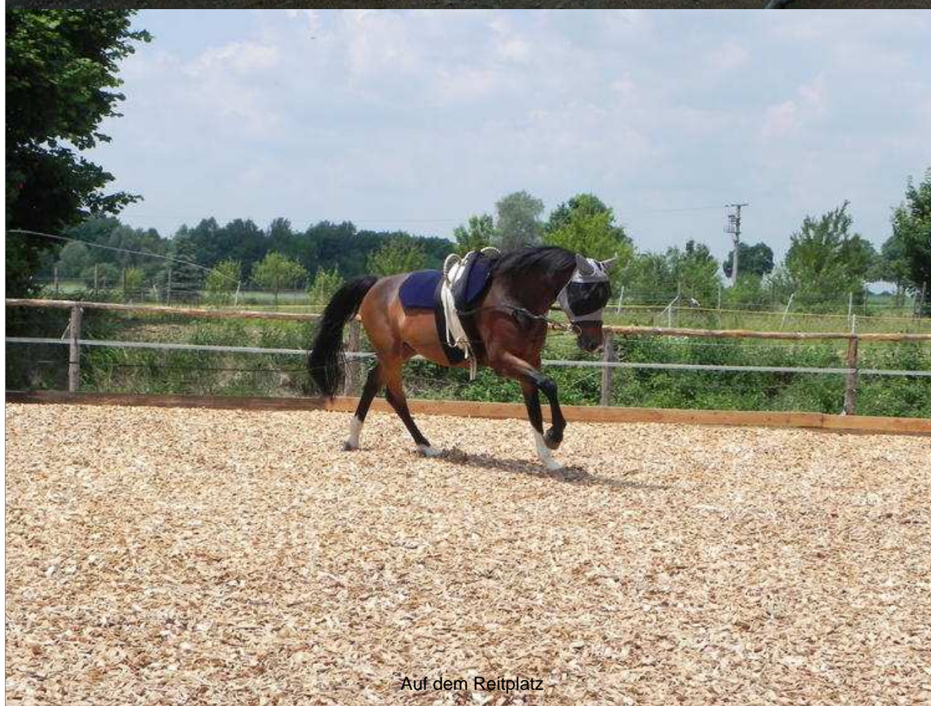
Auf dem Reitplatz