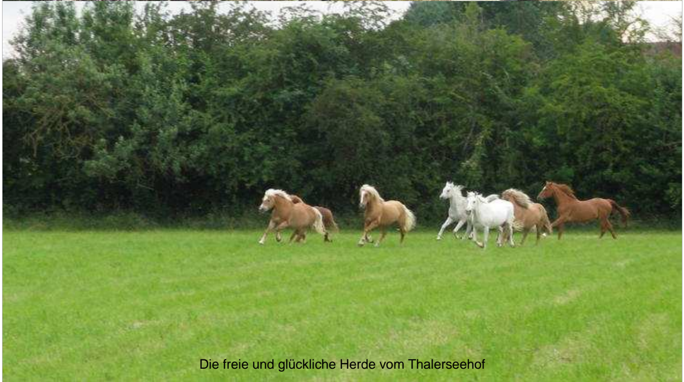
Die freie und glückliche Herde vom Thalerseehof