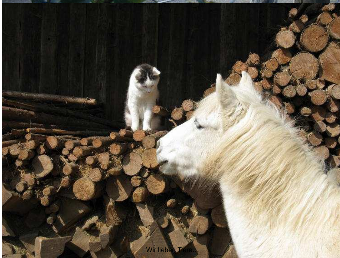
Wir lieben Tiere...