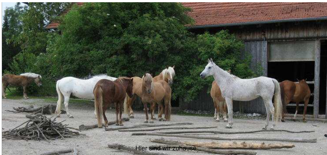
Hier sind wir zuhause