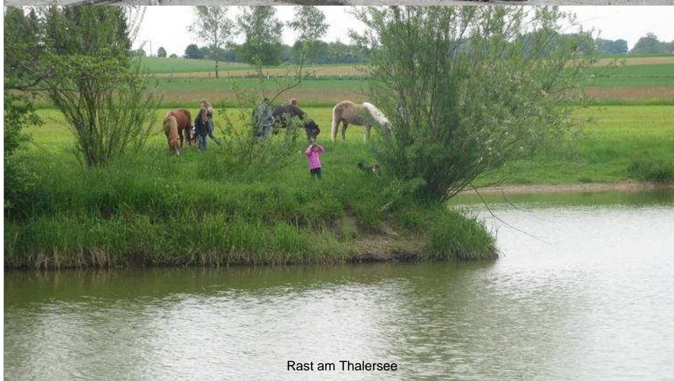
Rast am Thalersee