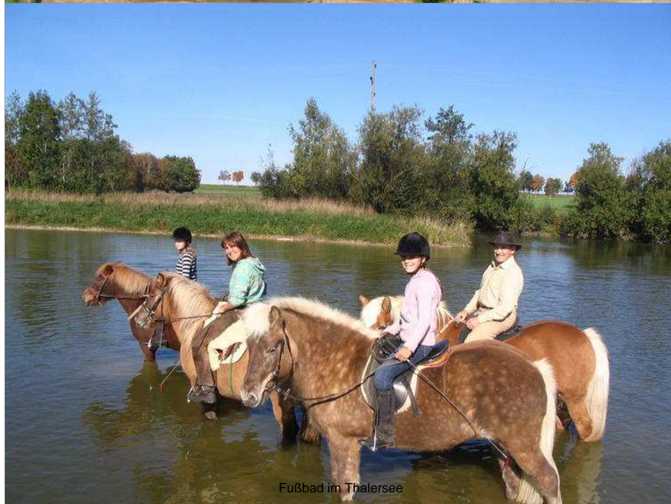
Fußbad im Thalersee